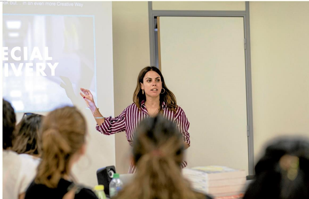
Además de disfrutar de experiencias de campo y en el aula, se ofrecen charlas especiales con importantes referentes de diseño, periodismo y producción.